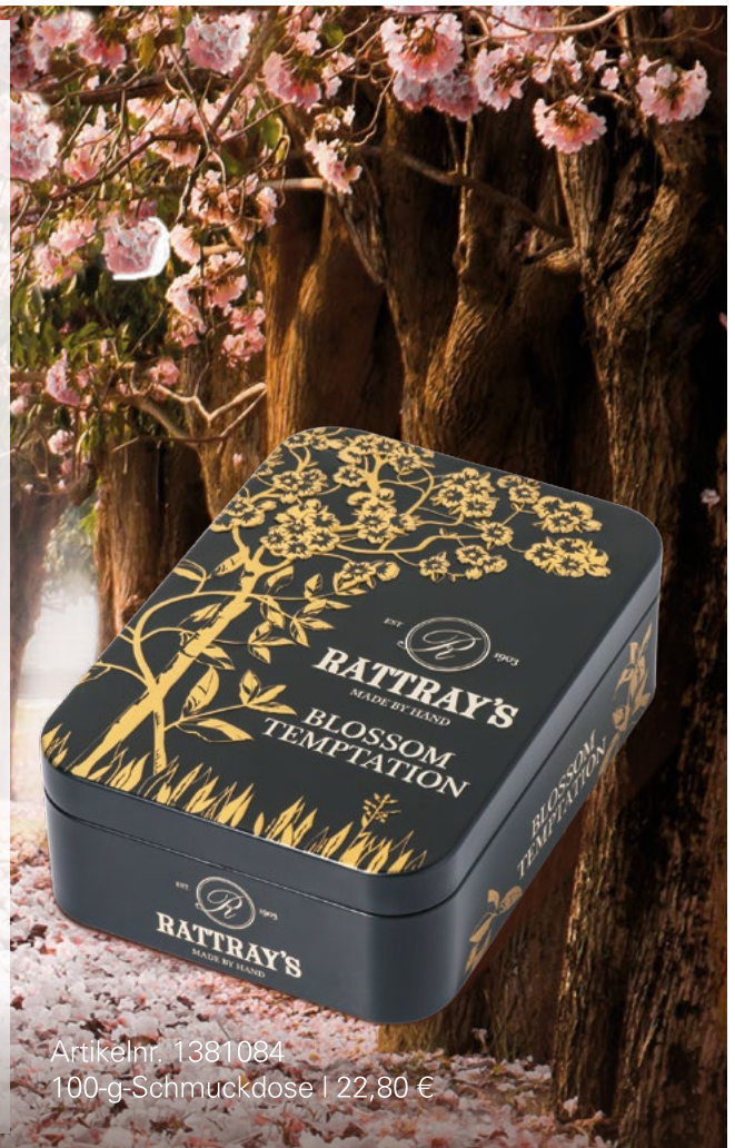
Artikelnr. 1381084 100-g-Schmuckdose | 22,80 €

Ganz im Zeichen der Kirschblüte hat man im Hause Rattray's das Aroma von saftig-süßen, reifen Kirschen aus dem Piemont gewählt. Unterstrichen wird dieser Duft von schwarzen Johannisbeeren, wodurch sich dieser Blend wunderbar fruchtig präsentiert. Die herausragende Komposition aus gold-braunem Virginia und Broken Flake wird gekrönt von Black Cavendish, welcher schwarze Akzente im Tabakbild setzt. ■