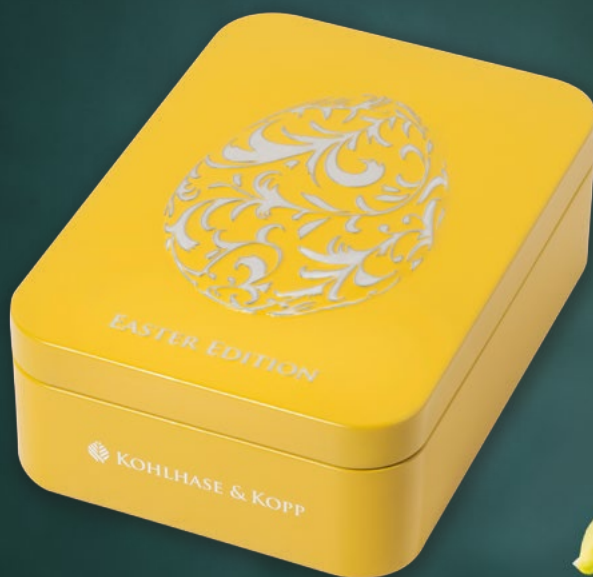
Artikelnr. 1381083 100-g-Schmuckdose | 22,80 €